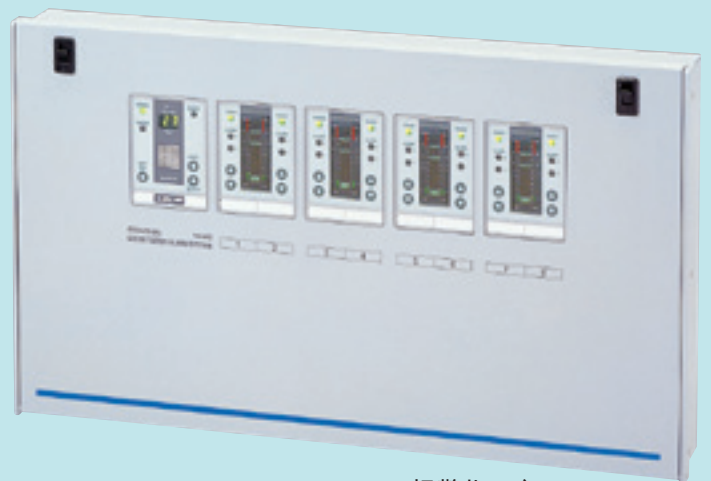
报警指示部 照片是8点式。 除此之外还有2·4·6·10·12点式。