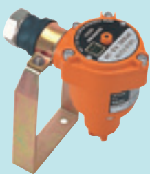
扩散式检测部 KD-5 (d2G4)