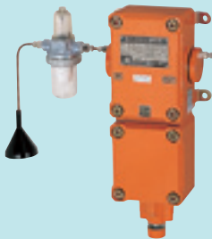
吸引式检测部 PE-2DC (d2G4)